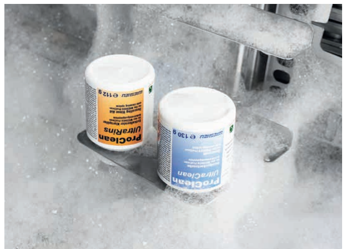
Automatisches Reinigungssystem ProClean